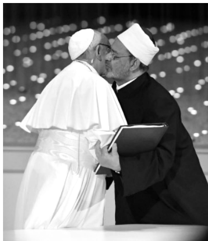
Le pape François avec le « Grand Imam » d'Al-Azhar

CETTE QUESTION se pose de plus en plus devant les scandales que donne le pape actuel. Un exemple récent est fourni par le « document sur la fraternité humaine pour la paix mondiale et la coexistence commune », signé à Abou Dabi le 4 février 2019, par le pape François et le « Grand Imam » d'Al-Azhar, Ahmad Al-Tayyeb, dans lequel nous trouvons la phrase suivante : « Le pluralisme et les diversités de religion, de couleur, de sexe, de race et de langue sont une sage volonté divine, par laquelle Dieu a créé les êtres humains 1 . » Autant on peut attribuer à la « sage volonté divine » la diversité entre les hommes et les femmes, autant on ne saurait lui attribuer la diversité des religions dont la seule cause est le péché des hommes.